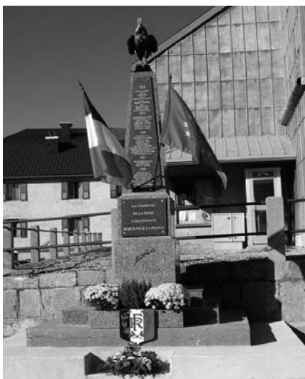
> Le monument rénové