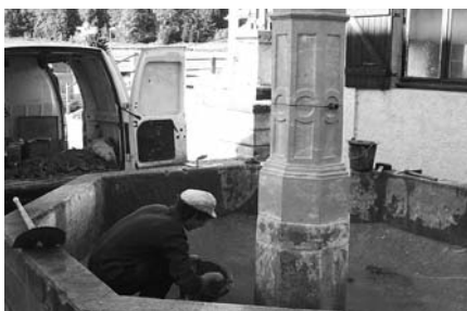
> Le tailleur de pierre finit son travail

Parallèlement, un autre chantier a vu le jour récemment : la commune a fait de gros