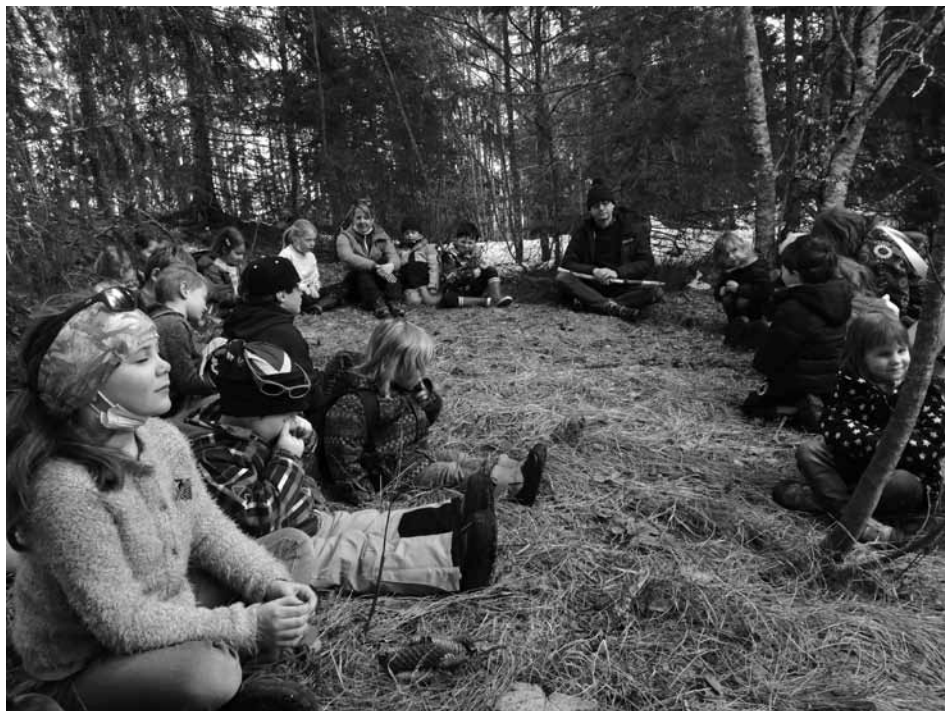
△ Temps de regroupement avant les activités