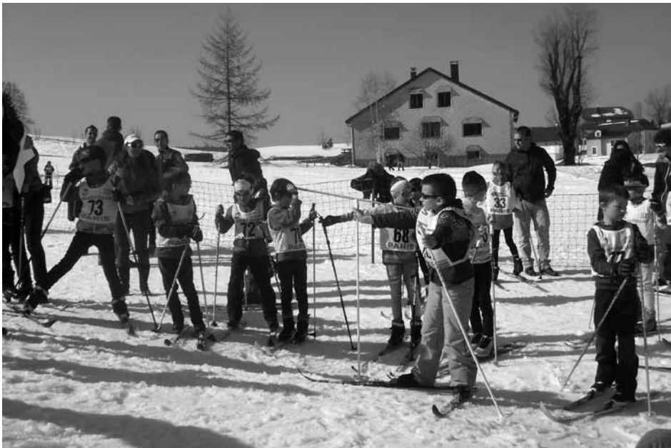
△ La course des P'tits loups, le 19 mars dernier

Dimanche 22 Mai 2016 : l'association Les Amis de la Borne au Lion et du Crêt de Chalam propose une sortie journée au Plateau des GLIÈRES (Haute-Savoie), haut lieu de la Résistance lors de la Seconde Guerre mondiale.