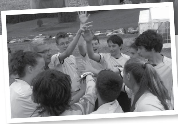
C'était le 25 juin : volonté et plaisir de jouer collectif.